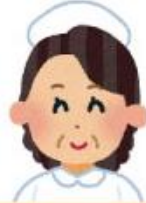
保健師または地域で活動経験のある看護師