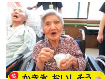
かき氷 おいしそう