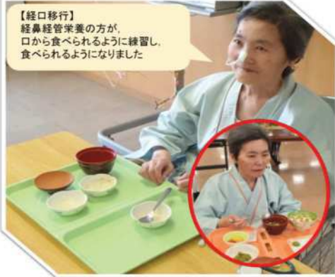
【経口移行】 経鼻経管栄養の方が、口から食べられるように練習し、食べられるようになりました

はくじゅでは、ご高齢の方、介護が必要になった方が、 最後まで自分の口で食べ物を噛み、味わって食べる こと、そして 自分らしく生活できる ようプロジェクトを立ち上げて取り組んでおります。