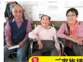
ご家族様とご一緒に