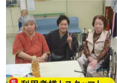
利用者様とスタッフと

予告 文化祭が11/11(土)に開催されます。 ご家族の皆様のご参加もお待ちしております。