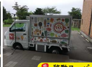
移動スーパーでお買い物