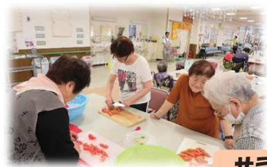
サラダ&夏野菜カレーをつくる