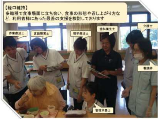
【経口維持】 多職種で食事場面に立ち会い、食事の形態や仕上げり方など、利用者様にあった最善の支援を検討しております